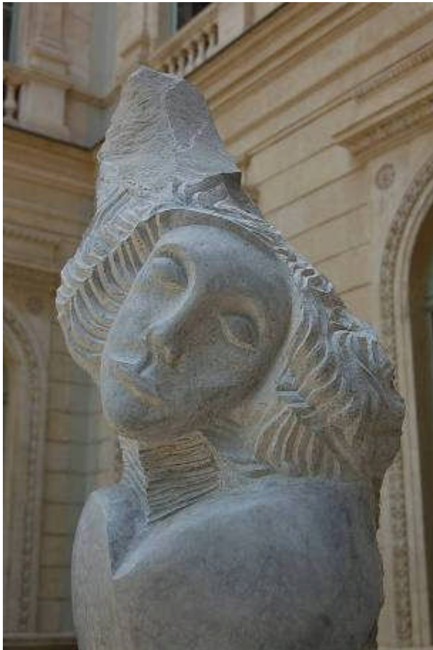
LA DAME . 1,90mx 0,40m Hall d'accueil immeuble PRIMAGAZ Paris

L'utilisation du gaz intervient pour la découpe et la soudure lors de la réalisation de pièces monumentales faites en fer, acier, argent ou or.