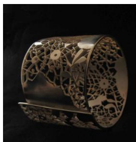
BRACELET DENTELLE 2010